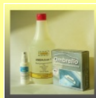
BESTE SICHT-Bundle 1xOmbrello + 1xANBAClean1 + 1xVISIO Antibeschlag Spray